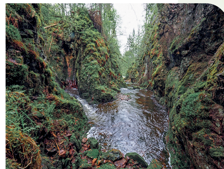
Punkt 15. Vakkert, men utilgjengelig terreng i Sølvhølen i Urselva, sett fra skjerpstet.