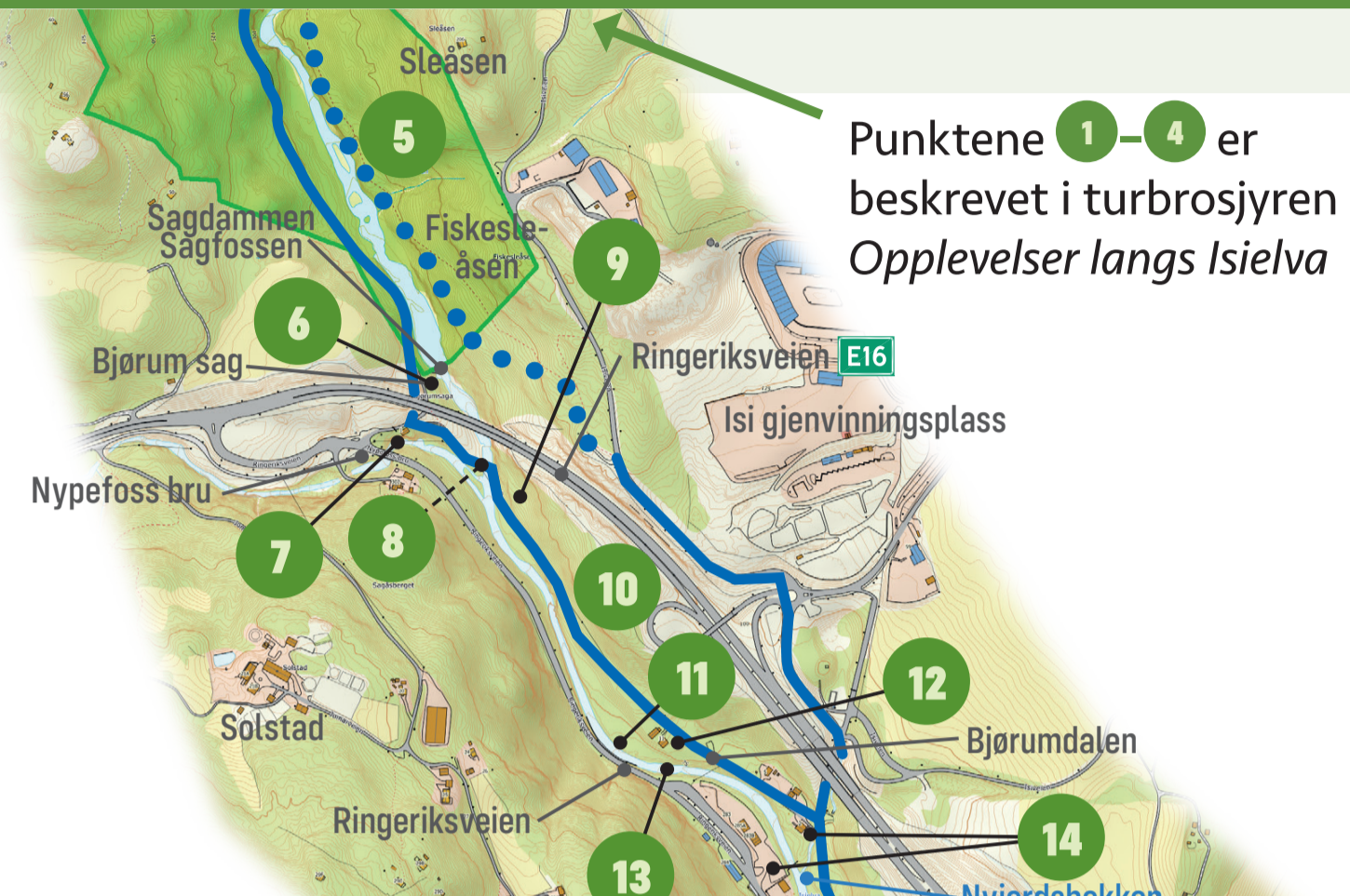
Punktene 1-4 er beskrevet i turbrosjyren Opplevelser langs Isielva