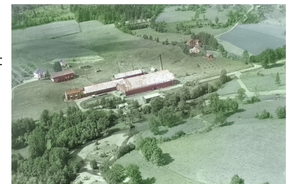
Punkt 33. Ringvoll Teglverk var største arbeidsplass i Skuidalen etter at Bærum verk ble støperi. (fargelagt)