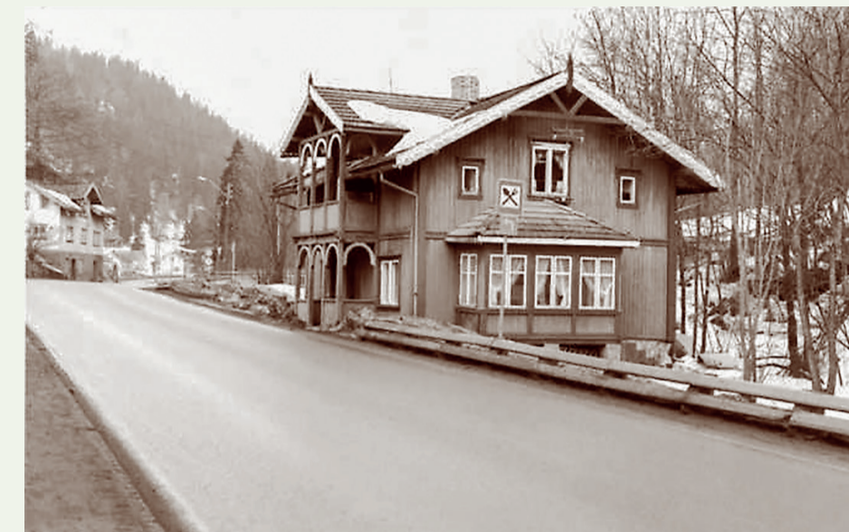
Punkt 18. Smedstad kafé anno 1977 med landhandleriet i bakgrunnen til venstre, og Bjørumsbrua bak kaféen.