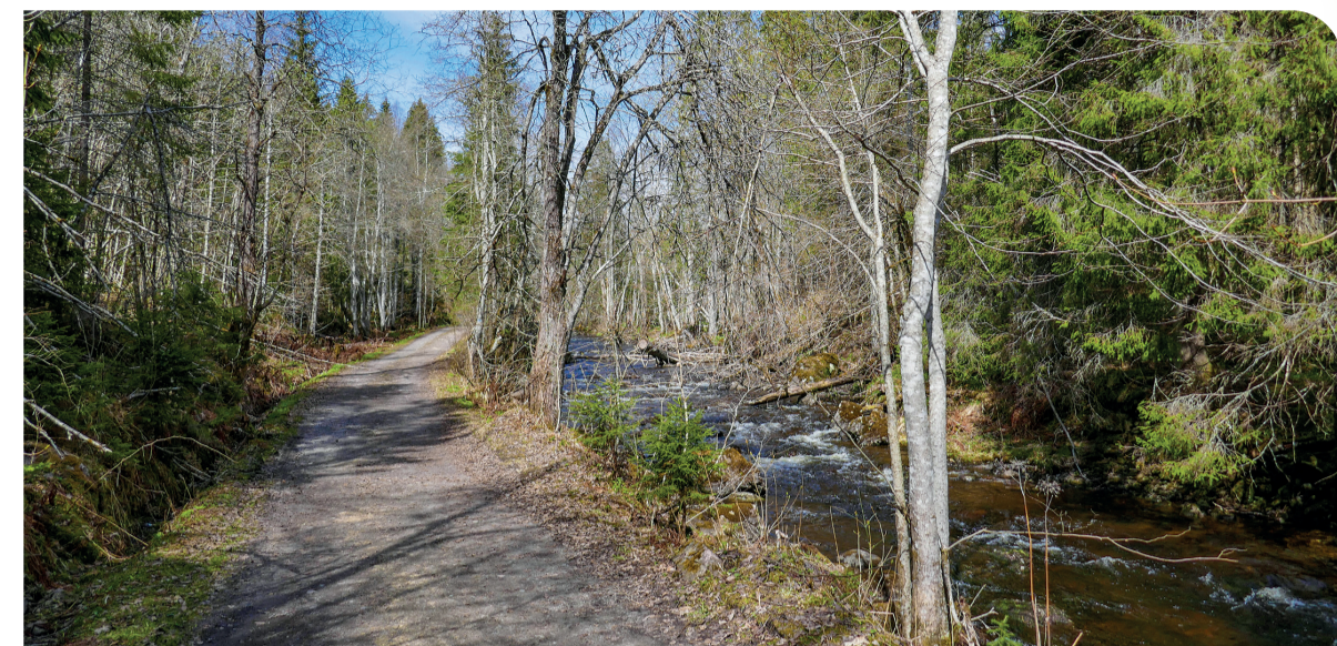
Punkt 1-4. Velkommen til Kjaglidalen.