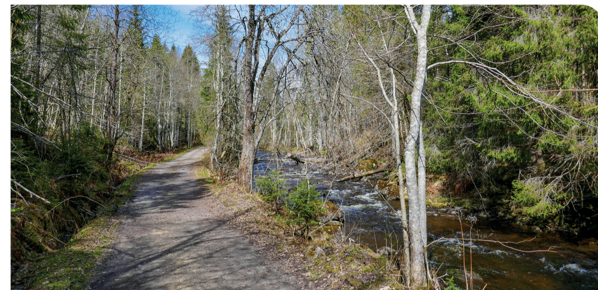
Punkt 1-4. Velkommen til Kjaglidalen.