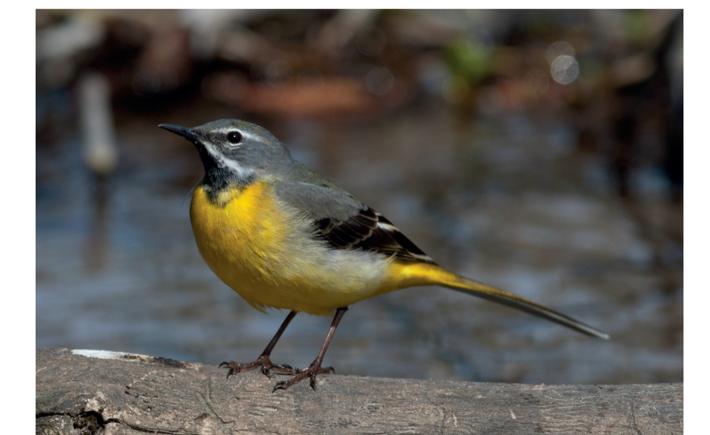
Vintererla kommer fra vinterkvarter allerede i slutten av mars, og hekker langs hele vassdraget. De aller fleste forlater elva i september-oktober.